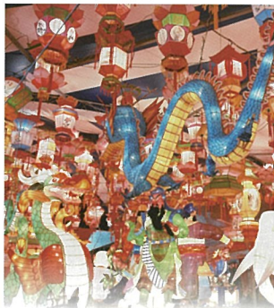
3 长崎灯会 (长崎市 春节期间)