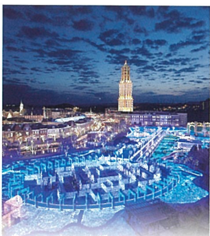
5 光之王国 (豪斯登堡)