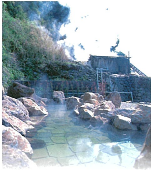
3 岛原温泉 (岛原市)