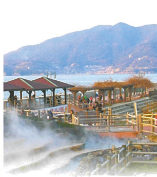
5 小滨足汤 (云仙市)